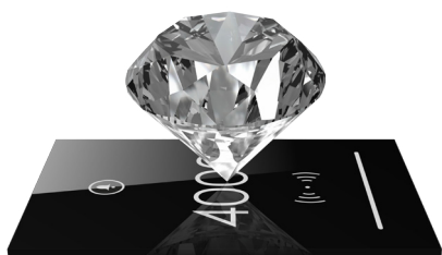
Allure Grand White&Black