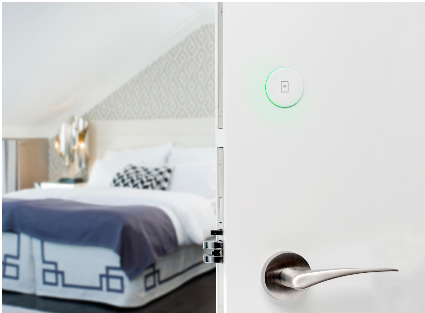
Serratura VingCard modello ESSENCE RFID